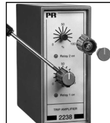
Рис. 2: Снятие поворотных ручек