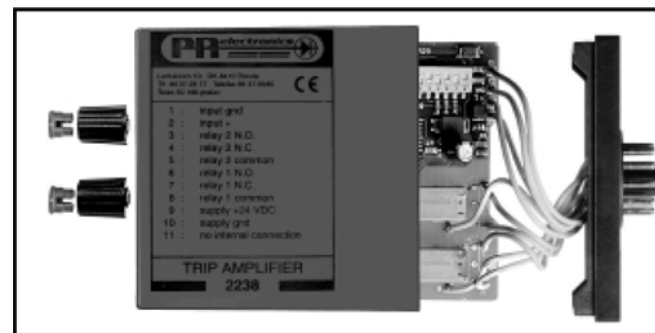
Рис. 3: Извлечение платы для изменения положений переключателей и перемычек